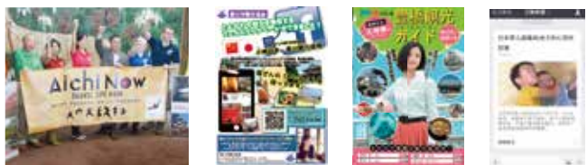
愛知県観光協会SNSの配信受託