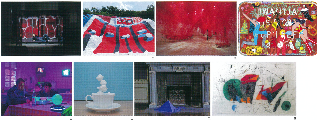
1. アンネ・イムホフ《Natures Mortes》2021, Palais de Tokyo, Paris, Cast: Eliza Douglas, Photo: Nadine Praczkowski, Courtesy of the artist and Palais de Tokyo. / 2. ノリー・マギー、リボンアート・フェスティバル2019(宮城県)の展示風景。Photo: Nori Ushio. © Barry McGee; Courtesy of the artist, Perrotin, and Reborn Art Festival. / 3. 塩田千春《不確かな旅》2016/2019、個展「魂がふるえる」森美術館、東京。Photo: Sunhi Mang, Courtesy of Mori Art Museum. © JASPAR, Tokyo, 2021 and Chiharu Shiota. / 4. ケイリン・ウイスキー《セブン・シスターズ・ソング》(Seven Sisters Song) 2021、ビクトリア州立美術館蔵。Courtesy of the artist, Iwantja Arts and Roslyn Oxley9 Gallery. / 5. 曹斐《ツァオ・フェイ》(新景) 2019, Courtesy of the artist, Vitamin Creative Space and Sprüth Magers. / 6. 奈良美智《Fountain of Life》2001, 2014, 「奈良美智 for better or worse」豊田市美術館, 2017. © Yoshitomo Nara. Photo: Mie Morimoto. / 7. ローター・ハウムガルテン《Tetrahedron》1968. © Lothar Baumgarten Estate, VG Bild Kunst. / 8. ニヤカロ・マレク《Enclosed》2020, Photo: Andrew Wessels, Courtesy of the artist.

10:00-18:00(一宮市役所は17:15まで Ichinomiya City Hall is closed at 17:15)/月曜休館(祝休日は除く) Closed on Mondays (Except for Public Holidays)